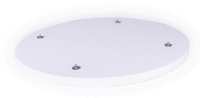
Soundstone kaderloos eiland rond; blik op de bovenzijde (inclusief ophangogen)